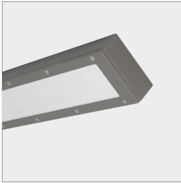
DPB 200 Montage als Einzeleuchte